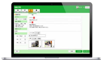
先生が使用する画面イメージ

学校や幼稚園、保育園からの連絡は、今お使いのインターネット接続パソコンからブラウザを利用して操作いただけます。