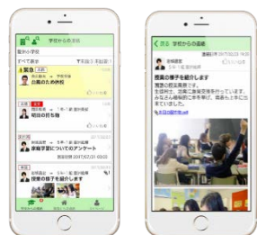
保護者が使用する画面イメージ

保護者の皆様は、お使いのスマートフォンにアプリをダウンロードし、学校や幼稚園、保育園から配布いただくID、パスワードを入力することでご利用いただけます。